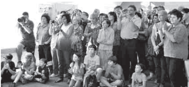
Zahlreiche Besucher folgten den Vorführungen